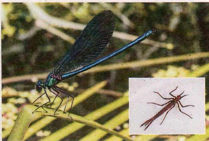
Bild 2: Ausgewachsenes Tier und im Gewässer lebende Larve der strömungsliebenden Prachtlibelle.

2009 wurde von Lflur und Landesverband der Wasser- und Bodenverbände (LWBV) ein Projekt gestartet, bei dem an fünf Fließgewässerstrecken auf eine schonende Unterhaltung umgestellt wurde und die Wasserpflanzen, wirbellosen Tiere und Strukturen vor und nach der Umstellung untersucht wurden. Bis 2009 wurde an allen Strecken eine weitgehend intensive Unterhaltung durchgeführt. Ab Herbst 2010 erfolgte die Umstellung der Unterhaltung, indem durch wechselseitiges Kräutern der Sohle ein schlängelnder Stromstrich erzeugt wurde (siehe Bild 1). Begleitet wurden die Unterhaltungsmaßnahmen von einer