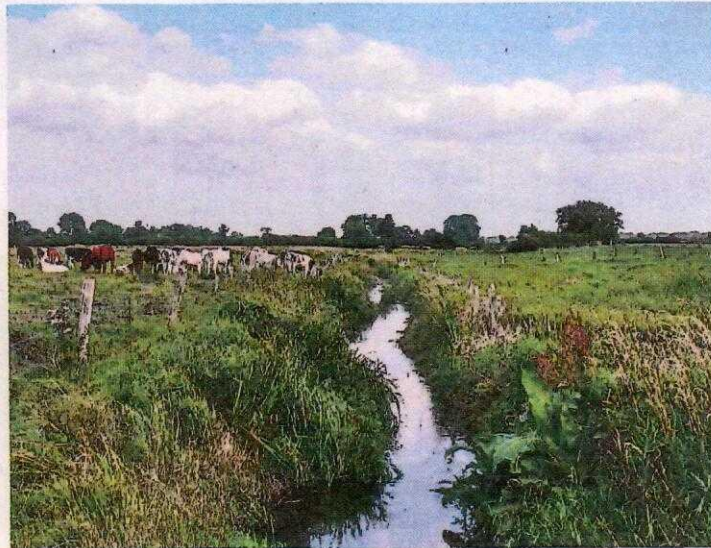
Bild 1: Durch schonende Gewässerunterhaltung hat sich aus dem ehemals intensiv unterhaltenen, strukturarmen Gewässer ein schlängelnder Stromstrich mit wechselnden Strömungsverhältnissen und einer Vielzahl von Lebensräumen für Fische und wirbellose Tiere entwickelt.

Schonende Gewässerunterhaltung fördert die Vielfalt an Pflanzen und Tieren in unseren Fließgewässern und dient den Zielen der europäischen Wasserrahmenrichtlinie. Untersuchungen zeigen, dass eine schonende Gewässerunterhaltung in vielen Fließgewässern praktikabel und kosteneffizient ist und gleichzeitig der ordnungsgemäße Abfluss weiterhin gesichert ist. Die Umsetzung ist aber nur gemeinsam mit allen an der Unterhaltung Beteiligten möglich und bedarf eines intensiven Austauschs, um nachhaltige Akzeptanz zu erlangen.